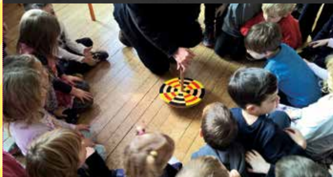
Pisan svet vrtavk v Tehniškem muzeju Slovenije v Bistri