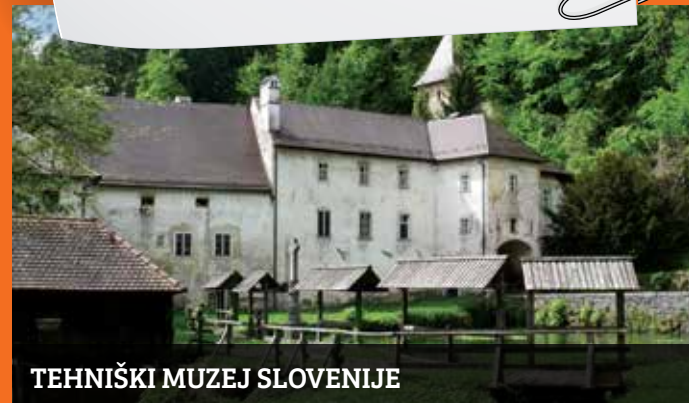
TEHNIŠKI MUZEJ SLOVENIJE