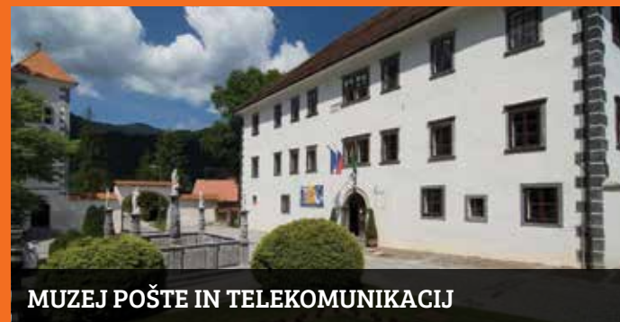
MUZEJ POŠTE IN TELEKOMUNIKACIJ

V zimskem času možen ogled za skupine z muzejskim vodičem.