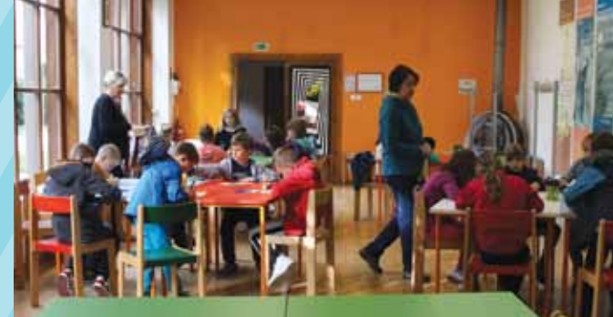
Delavnica v Tehniškem muzeju Slovenije v Bistri