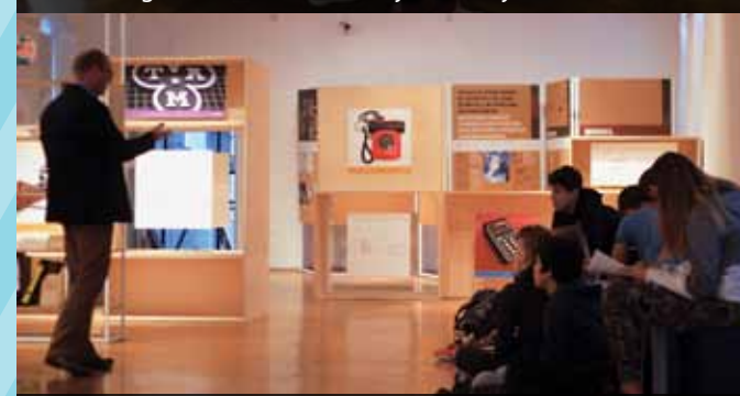
Predavanje v Tehniškem muzeju Slovenije v Bistri (projekt ICYDK)