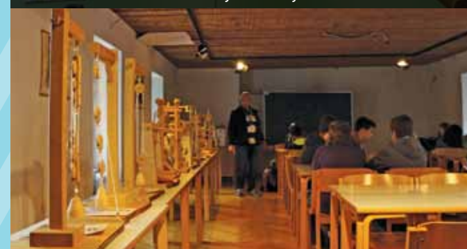
Prikaz Jurij Vega v Tehniškem muzeju Slovenije v Bistri