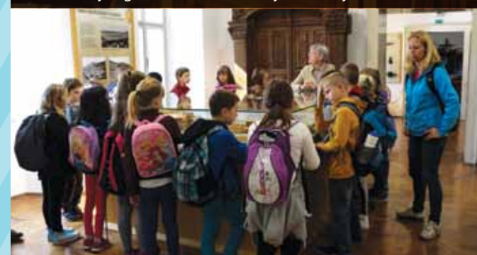
Vodeni ogled v Tehniškem muzeju Slovenije v Bistri