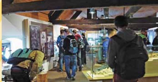
Vodeni ogled v Tehniškem muzeju Slovenije v Bistri