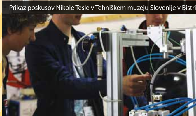
DiZiT v Tehniškem muzeju Slovenije v Bistri