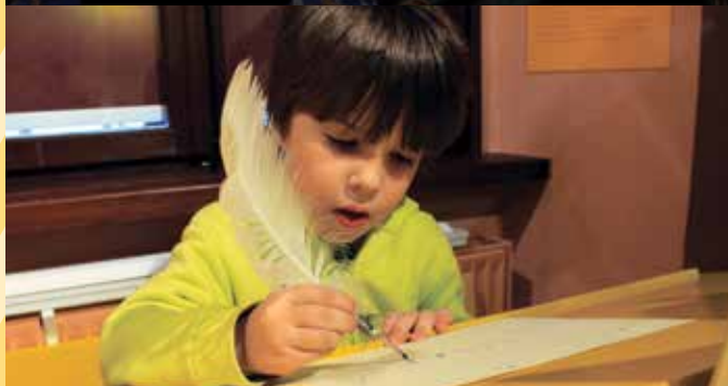
Pisalni kotiček v Muzeju pošte in telekomunikacij