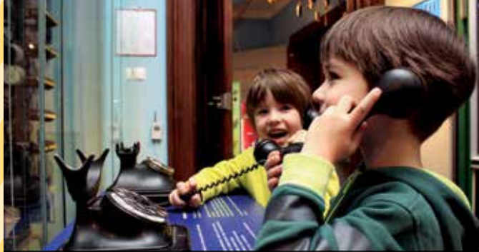
Muzej pošte in telekomunikacij v Polhovem Gradcu