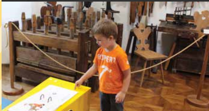
Interaktivni ogled v Tehniškem muzeju Slovenije v Bistri