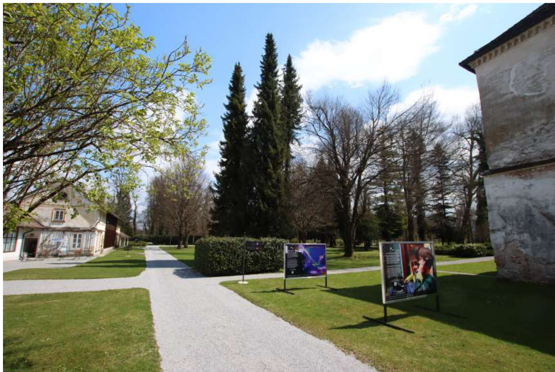
Fotografska razstava Z vami že 70 let: Tehniški muzej Slovenije 1951–2021 .