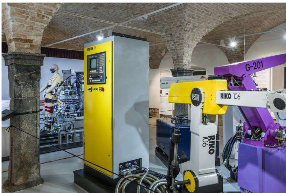
Razstava Robot.si : Začetki slovenske industrijske robotike.