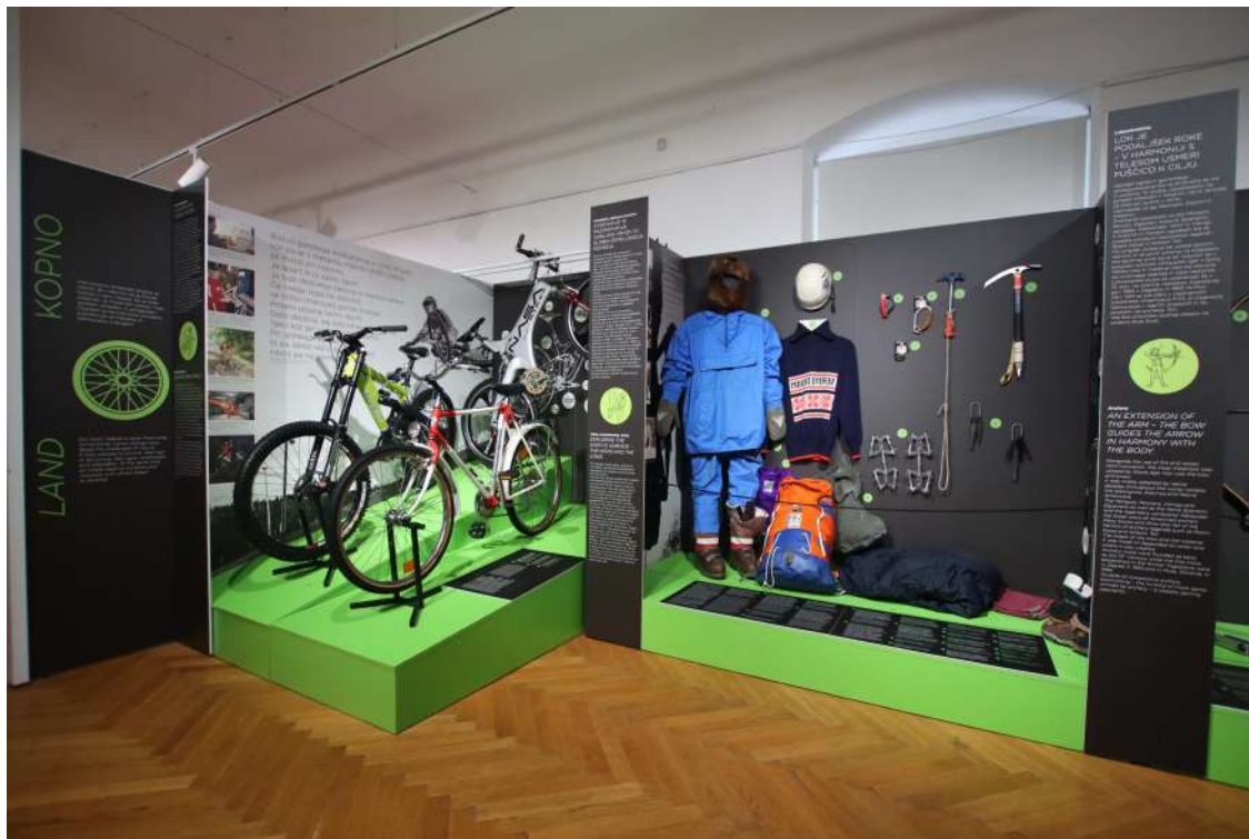
Razstava Tehnika za šport .