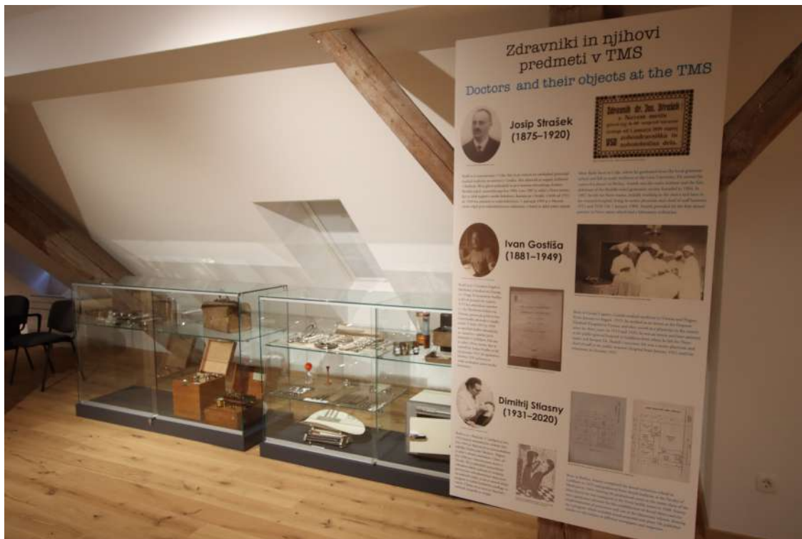
Razstava Zakladi iz depojev: Medicinski instrumenti in pripomočki.