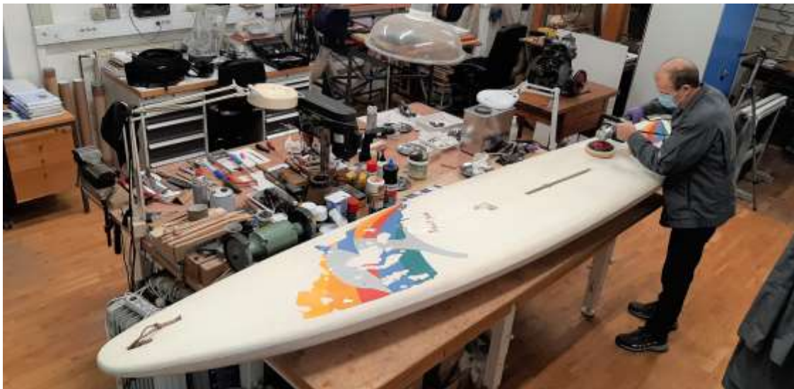
Restavriranje jadralne deske Veplas Burja iz začetka 80. let za razstavo Tehnika za šport.

razvoja predstavljajo tudi kakovostni rekreacijski pripomočki, ki spremljajo vsakodnevno gibanje, kar je v Sloveniji pomemben del načina življenja. V luči tehnoloških procesov, ki so v ozadju izdelkov, razstava predstavlja več kot 60 slovenskih proizvajalcev športne opreme .