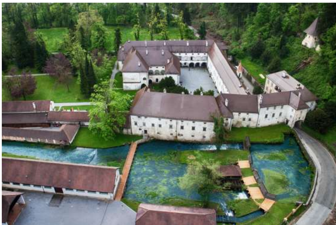
Tehniški muzej v Bistri.

Tehniški muzej Slovenije , ki je nastal s ciljem zbiranja, varovanja in raziskovanja gradiva, povezanega z razvojem obrti in industrije na slovenskih tleh , je bil ustanovljen 3. aprila leta 1951. V desetletjih delovanja je postal osrednji prostor varovanja in predstavljanja bogate slovenske tehniške dediščine, dosežkov slovenskih znanstvenikov ter najuspešnejših slovenskih industrijskih panog. V sodobnosti je muzej svojo vlogo kot mesto srečevanja, ustvarjalnosti, izmenjave znanja in interdisciplinarnega povezovanja še okrepil.