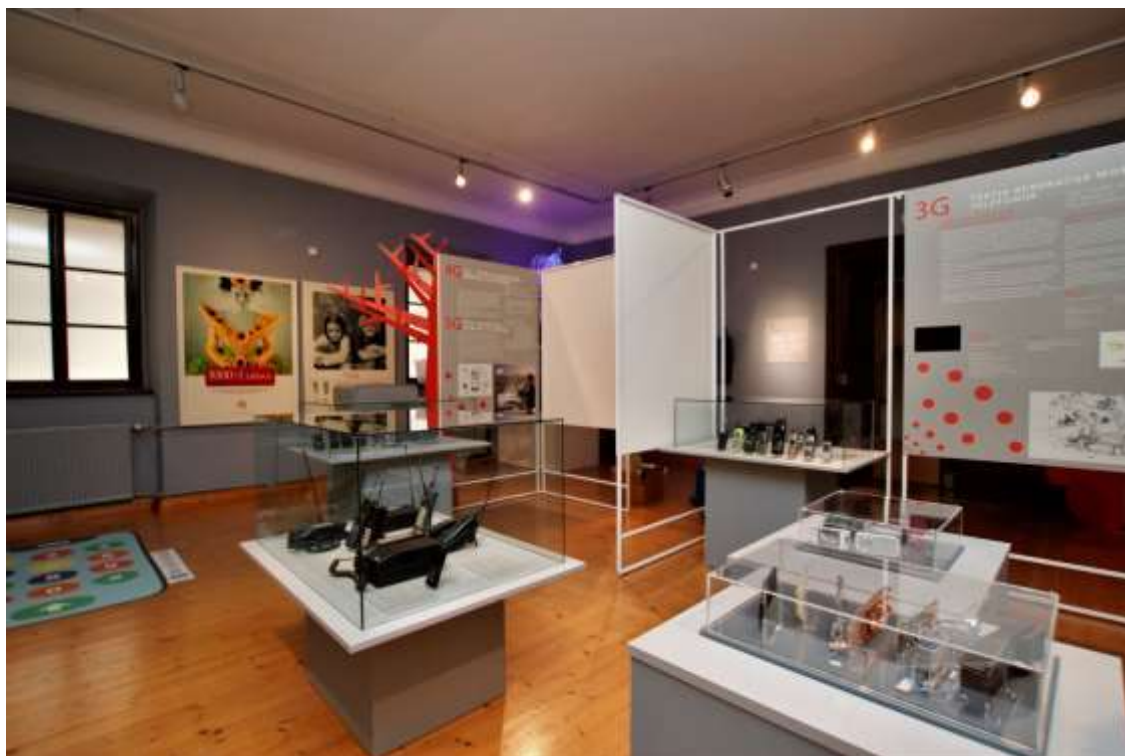
Razstava »Halo! Kje si?« v Muzeju pošte in telekomunikacij

1990 ter ovitek prvega dne v počastitev plebiscita , znamka Osamosvojitve Slovenije in osnutki, ki jih je izdelal Grega Košak , neizbrani osnutki prvih slovenskih rednih znamk in prve redne znamke, ki so izšle decembra 1991.