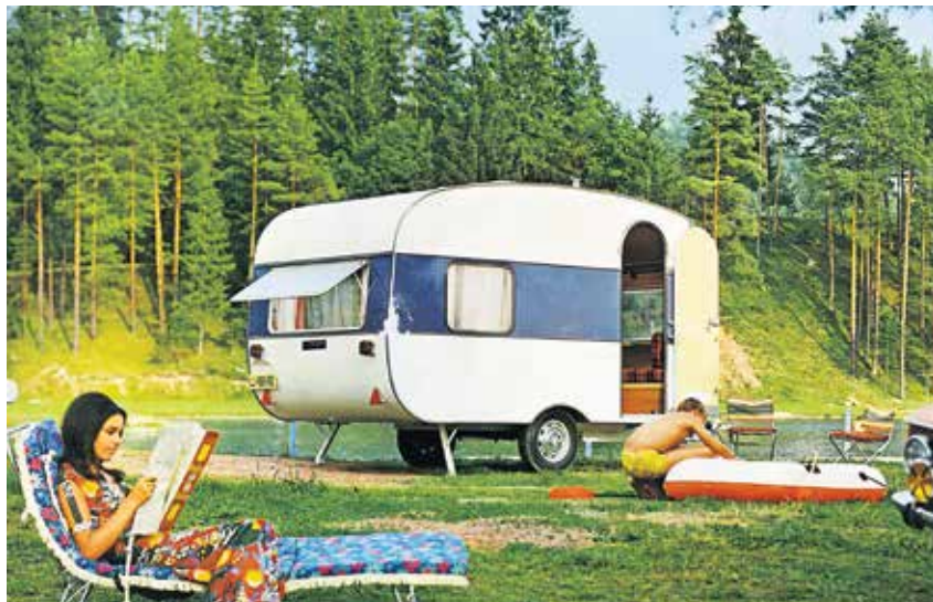
Ker je bila prikolica adria 305 majhna, lahka in okretna, je bila lažje mobilna in ni tako pogosto kot nekatere večje v kampih ostajala po več let.