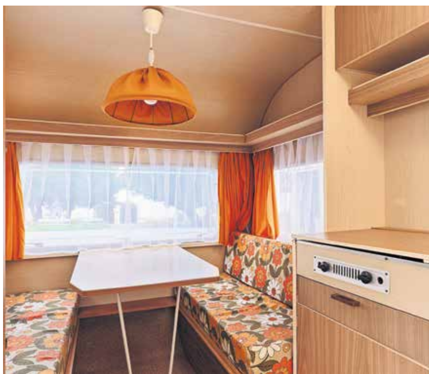
Notranjost prikolice adria 305 je bila enostavna.

čilen modri pas na beli podlagi. Pred tem so bile namreč IMV-jeve prikolice, tudi zgodnji primerki adrie 305, bele, modra barva pa je predstavljala morje, jadransko obalo, modrino, Jadran ... S tujko torej Adrio.