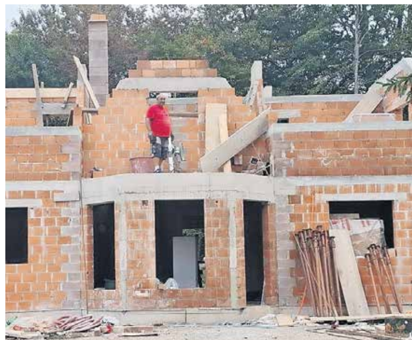
Gradnja nove hiše napreduje zelo počasi. Šestčlanska družina Grm - Zupančič bi si rada do konca leta uredila vsaj pritlične prostore, da bi se lahko vselili v hišo in Civilni zaščiti vrnila bivalna zabojnika.