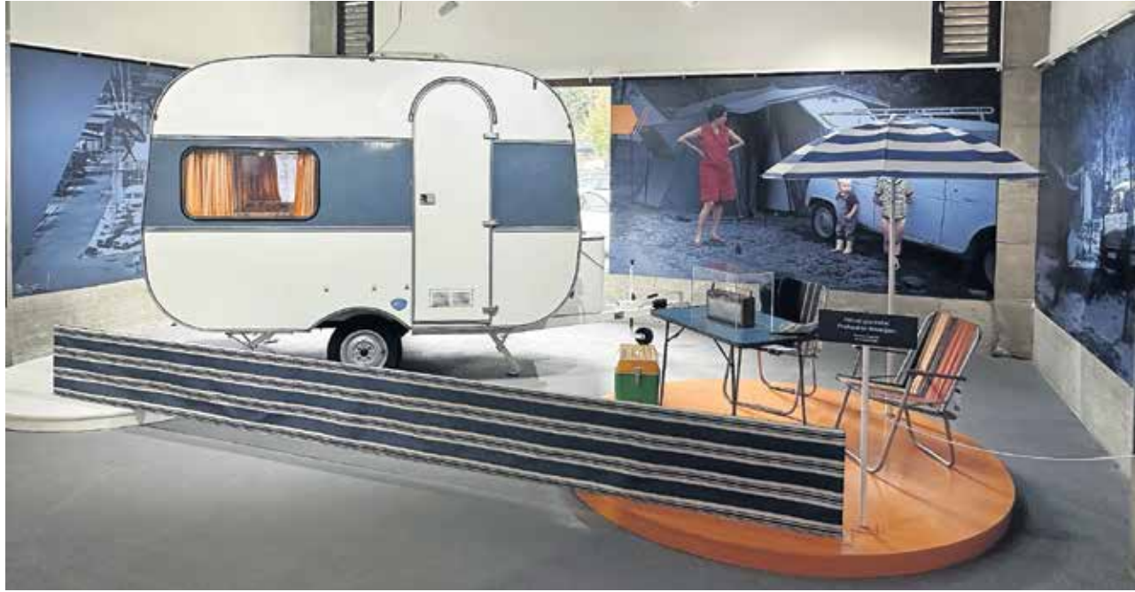
Osrednji prostor občasne razstave Modro na belem v Tehniškem muzeju Slovenije