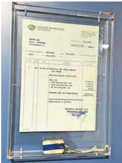
Račun ob nakupu prikolice adria 305. Dobrih 39.000 dinarjev bi bilo danes približno 8000 do 9000 evrov.